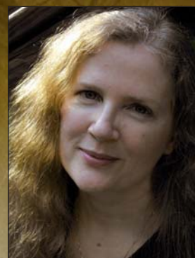
Suzanne Collinsová (*1947, New Jersey)

Katniss Everdeenové se obavami svíralo břicho, srdce, hrudník a já nevím co ještě (tedy, já vím, ale nesmím to napsat), protože nebezpečí v podobě Hladových her jí hrozilo vcelku velké. Poloviční sirotek, který se po otcově smrti musel postarat o mladší sestru a smutkem letargickou matku, rád nerad vyměnil své šance v osudí za šanci pro celou rodinu. Tohle je totiž Dvanáctý kraj, řečený Sloj, kde smrt hladem není nikterak výjimečná a kde upytlačenou zvěřinu kupují rádi i ti, kteří by za to měli lovec oficiálně trestat. Tentokrát ale měla Katniss štěstí, protože dívčím „splátcem“ testu za vzpouru proti Kapitolu byla vylosována – její dvanáctiletá sestra Prim...!